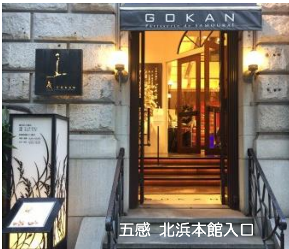
五感 北浜本館入口

● 納品先ユーザーご紹介：(有)五感 様 — http://www.patisserie-gokan.co.jp/ —